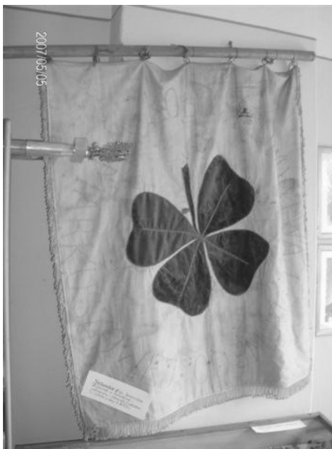
Fot. 3. Sztandar SL w Markuszowej.

Przy tej okazji warto wspomnieć o izbie pamięci, która znajduje się w Domu Ludowym w miejscowości Markuszowa. Poświęcona jest historii okresu międzywojennego i II wojny Światowej. W zbiorach znajdują się pamiątki z pobytu Wincentego Witosa w Markuszowej w roku 1932.