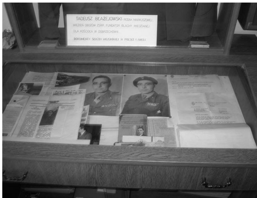
Fot. 5. Izba Pamięci Wincentego Witosa