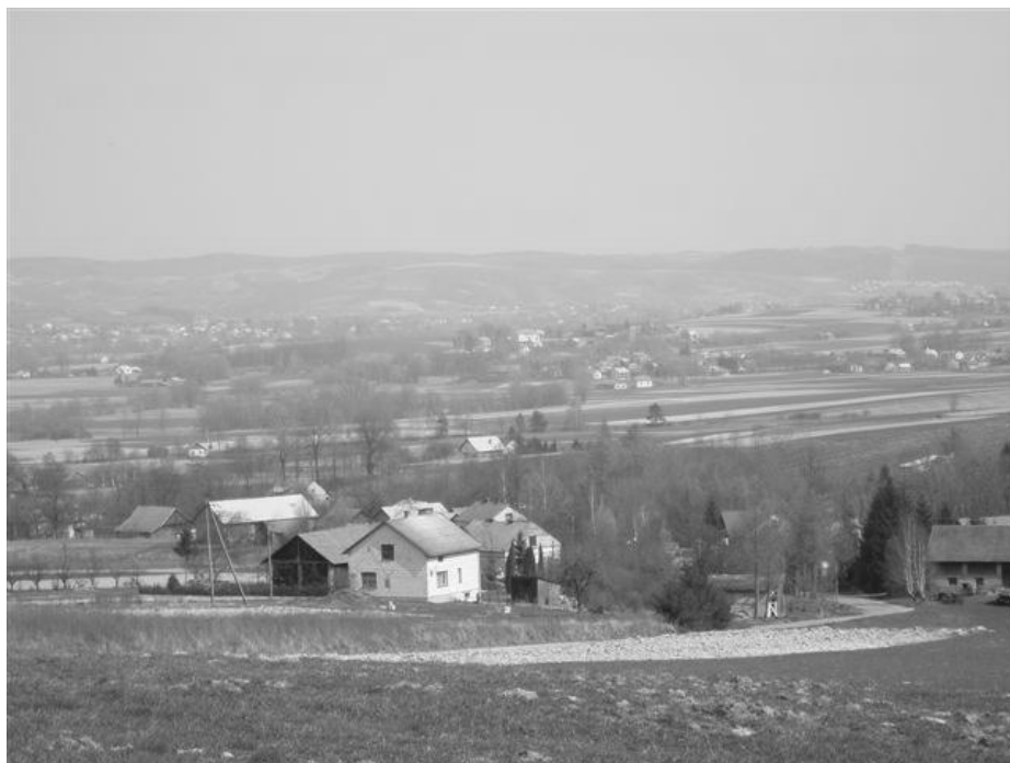
Fot. 1. Widok Markuszowej od strony Kozłówka.