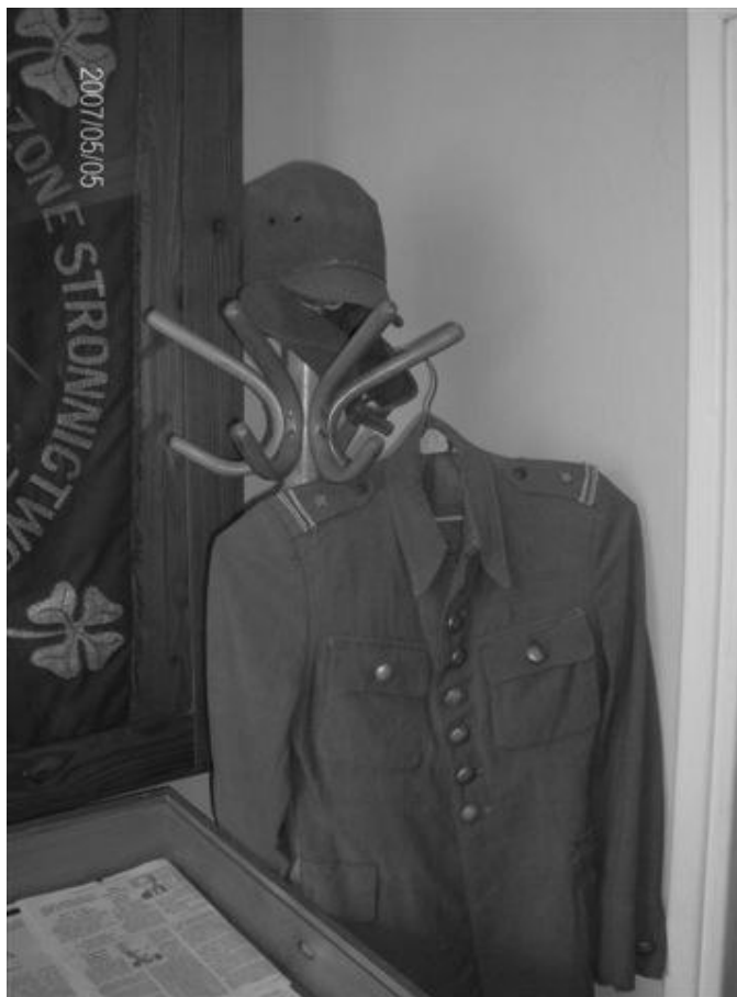
Fot. 4. Izba Pamięci Wincentego Witosa