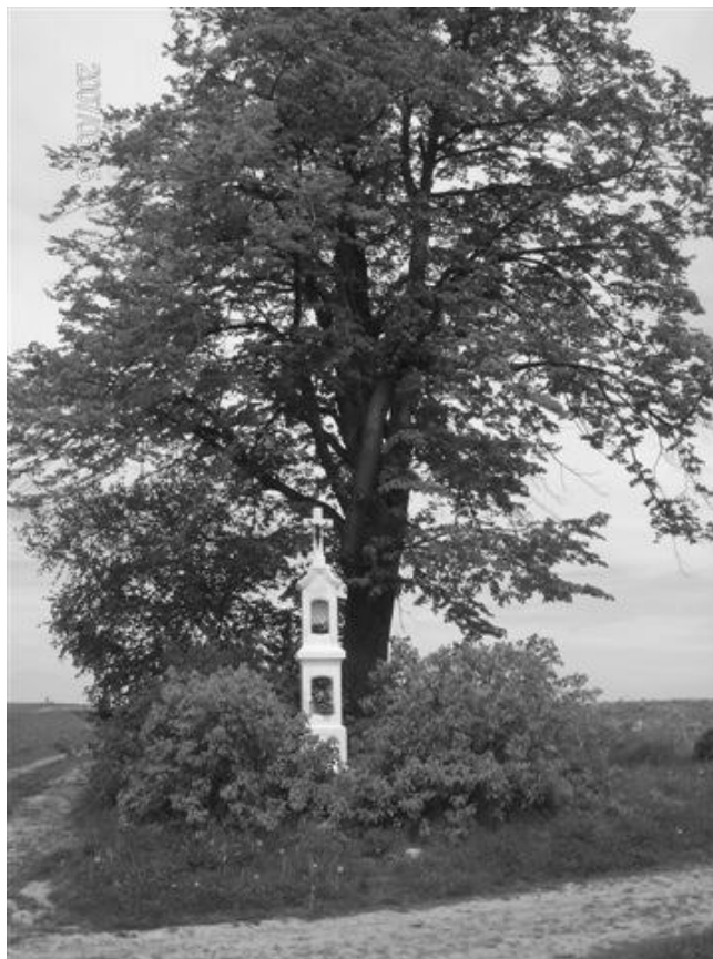
Fot. 2. Kapliczka przydrożna